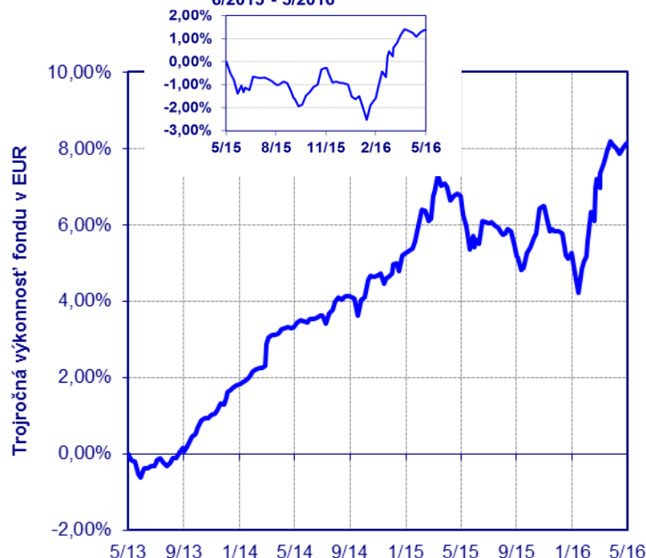
Výkonnosť fondu v EUR 6/2015 - 5/2016